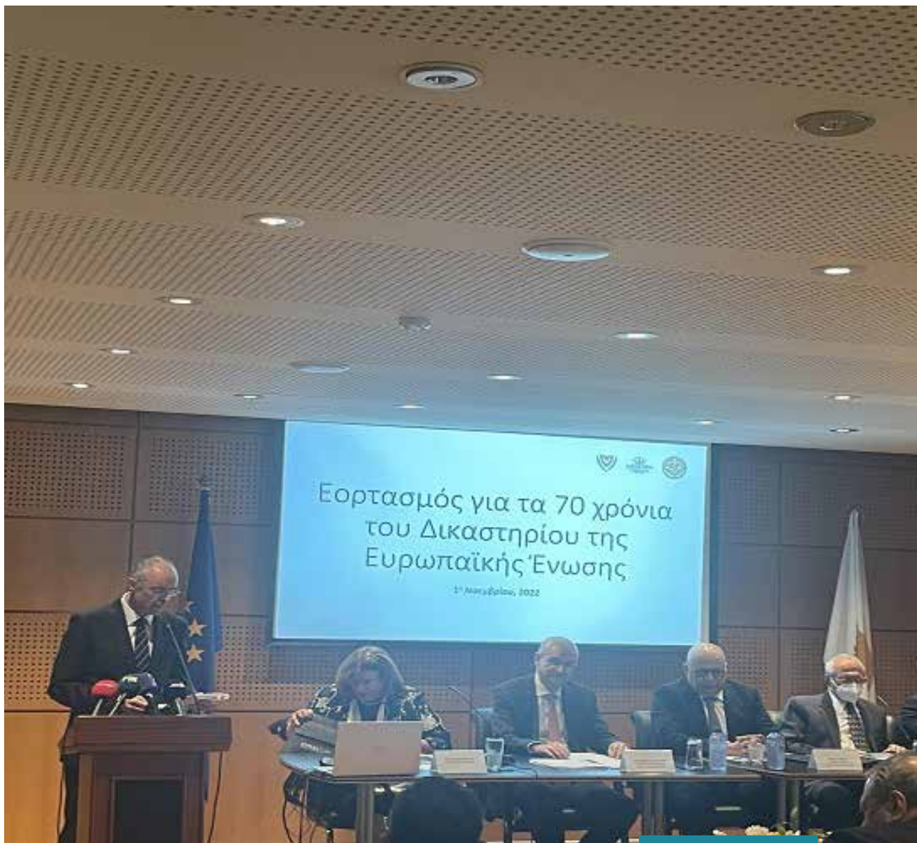
ΠΑΝΩ: Εορτασμός για τα 70 χρόνια του Δικαστηρίου της Ευρωπαϊκής Ένωσης, 1η Νοεμβρίου, 2022, Ανώτατο Δικαστήριο